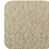
1370 Honey 1370 Miel