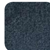
3438 Midnight 3438 Minuit