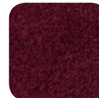
6285 Garnet 6285 Grenat