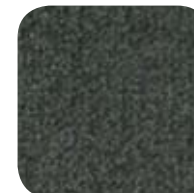
8550 Parsley 8550 Persil