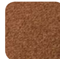
5212 Chili Powder 5212 Poudre de chili