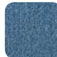
4243 China Blue 4243 Bleu Chine