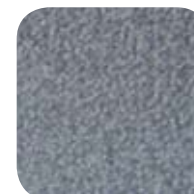
3371 Smoke 3371 Fumée