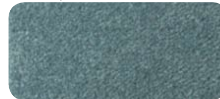
8662 Steel Green · 8662 Vert acier