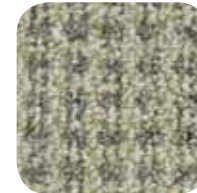
1278 Nile 1278 Nil