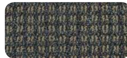
7309 Rio Grande