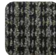
3244 Thames 3244 Tamise